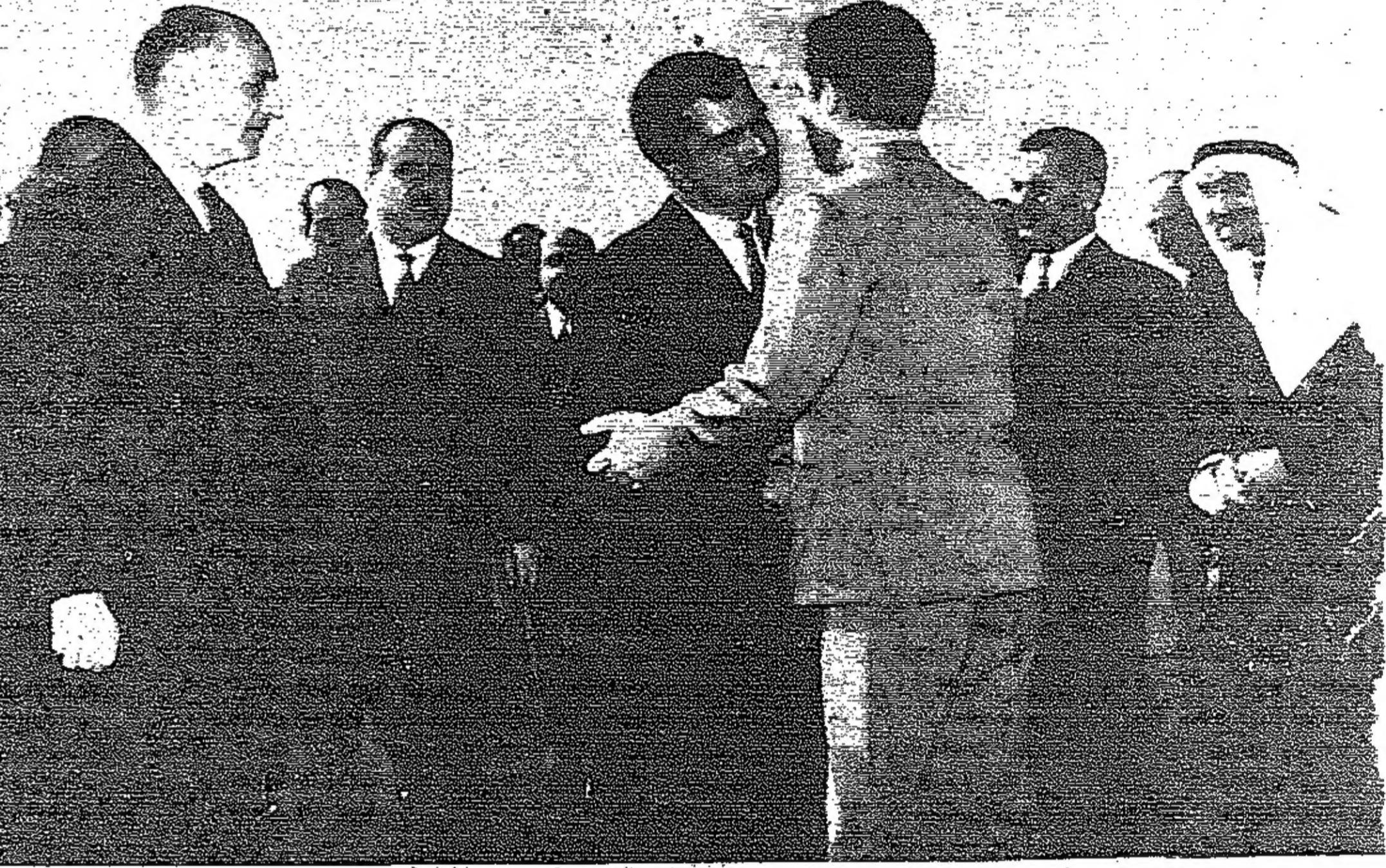
سمو الامير حسن ولي العهد المعظم يودع سمو امير محمد نائب جلالة الملك العظيم قبل مغادرته مطار عمان امس - ويرى في وداع سموه دولة السيد بهجت التلهوني رئيس الوزراء وكبار رجال الدولة

عمان - تعقد لجنة الرد على خطاب العرش ، المنبثقة عن مجلس النواب الاردني ، جلسة لها في الساعة الثامنة من صباح اليوم لوضع صيغة الرد على خطاب العرش .